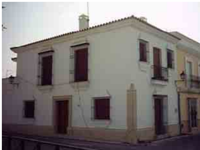
Casa en Avda de Jerez