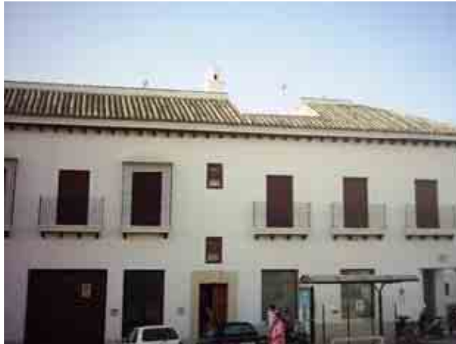
Casa de Avda de Chipiona