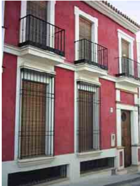
Casa de C/ Guzmanes