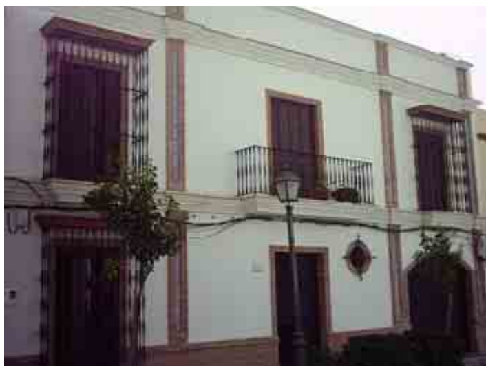
Casa en Avda de Jerez